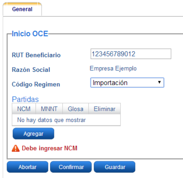
Imagen 2: Formulario inicio OCE

En primer lugar se solicita el RUT de la empresa importadora y el régimen de la operación a realizar. Seguidamente es necesario especificar las mercaderías que serán sujetas a la importación, agregándolas en la grilla. Por cada mercadería a agregar, es necesario presionar el botón “Agregar” e indicar en cada caso la Nomenclatura Nacional (NCM) y la Medida Nacional No Tributaria (MNNT=1004). La pantalla desplegada es la siguiente: