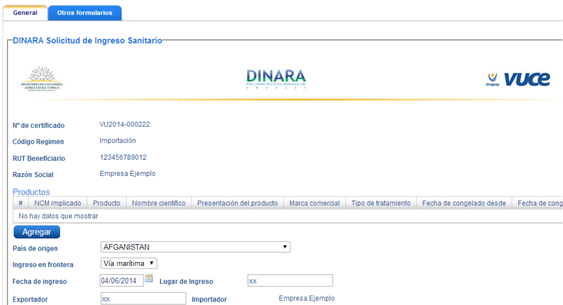
Imagen 6: Formulario Ingreso Sanitario

Luego de completar el formulario presionando el botón enviar se envía electrónicamente al organismo para su evaluación.