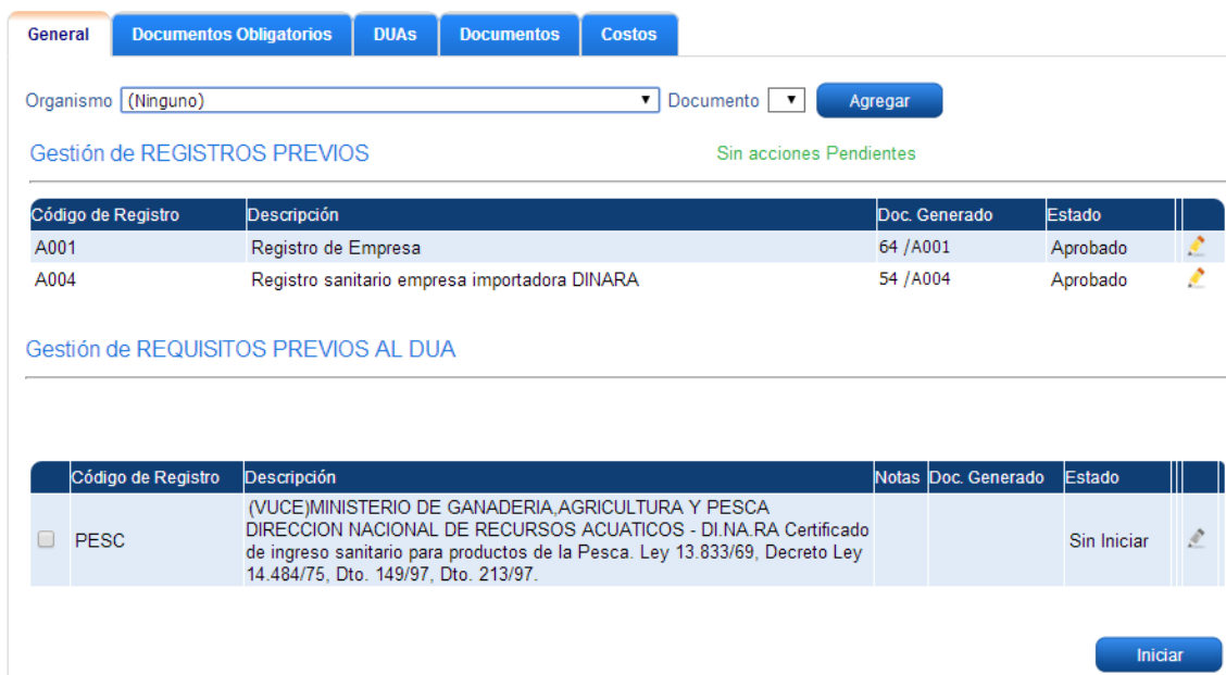
Imagen 5: Pantalla Momentos

Seguidamente se desplegará el formulario a ser completado donde todos los campos son obligatorios; es importante destacar que el Certificado Sanitario expedido por la autoridad competente del país de origen se debe adjuntar en forma obligatoria (es potestad del inspector actuante solicitar el Certificado Sanitario expedido por la Autoridad Competente del país de origen en formato papel y original).