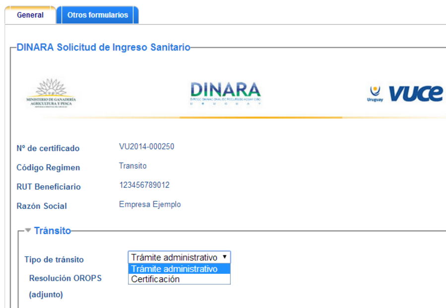
Imagen 5: Formulario Ingreso Sanitario

Seguidamente se desplegará el formulario a ser completado donde todos los campos son obligatorios; es importante destacar que el Certificado Sanitario expedido por la autoridad competente del país de origen se debe adjuntar en forma obligatoria (es potestad del inspector actuante solicitar el Certificado Sanitario expedido por la Autoridad Competente del país de origen en formato papel y original).